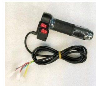
Enkelt vridreglage m fram-stopp-back

TILLVAL : INGÅR EJ I SATSEN OVAN men kan