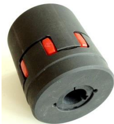
Klopppling: Motor-propeller axel

TILLVAL : INGÅR EJ I SATSEN OVAN men kan