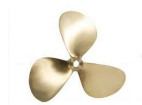
Axel o propeller 13/8 DINTRA