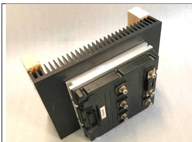
Kylfläns och styrdon avsett att monteras på vägg med eller utan fläkt.