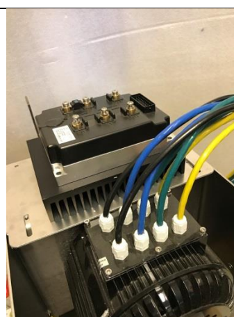
Kylfläns och styrdon avsett att monteras på S-drev med eller utan fläkt.